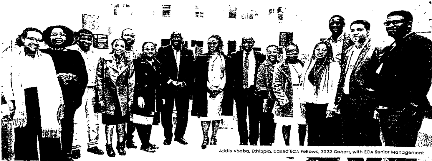
Addis Ababa, Ethiopia, based ECA Fellows, 2022 Cohort, with ECA Senior Management