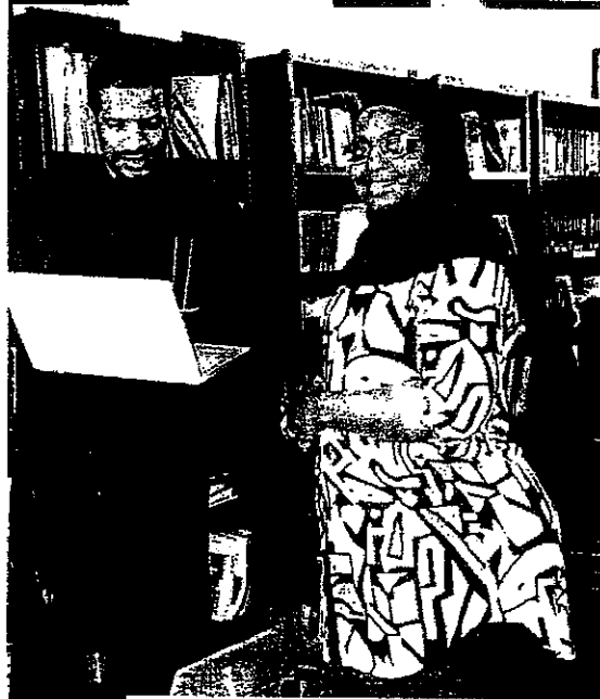
ECA Fellows, 2022 Cohort, based in SRC-CA