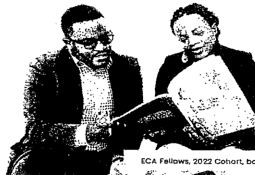
ECA Fellows, 2022 Cohort, based in SRO-SA