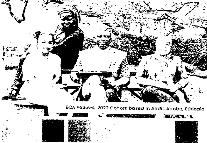
ECA Fellows, 2022 Cohort, based in Addis Ababa, Ethiopia