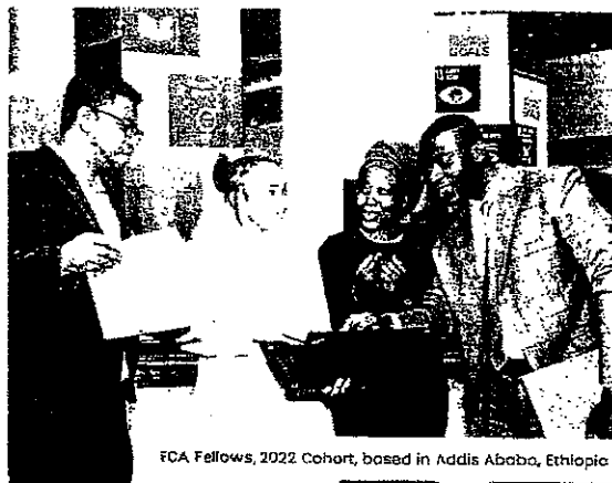
FCA Fellows, 2022 Cohort, based in Addis Ababa, Ethiopia